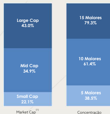
Carteira por market cap e concentração