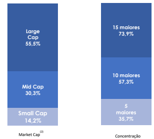
Exposição líquida por setor (média-mês)